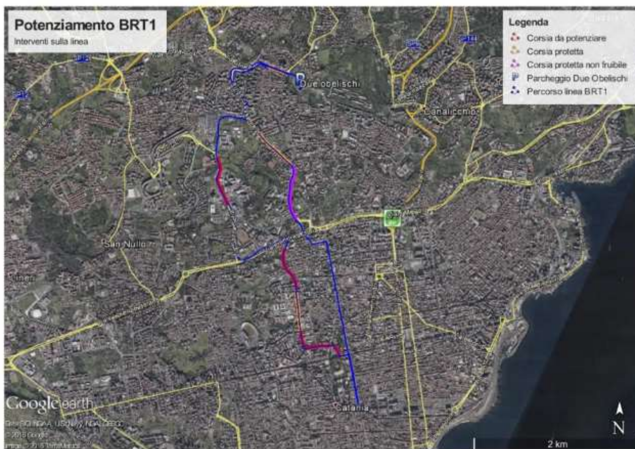
Percorso della linea esistente BRT1, lungo 12,7 km. In evidenza le zone d'intervento.